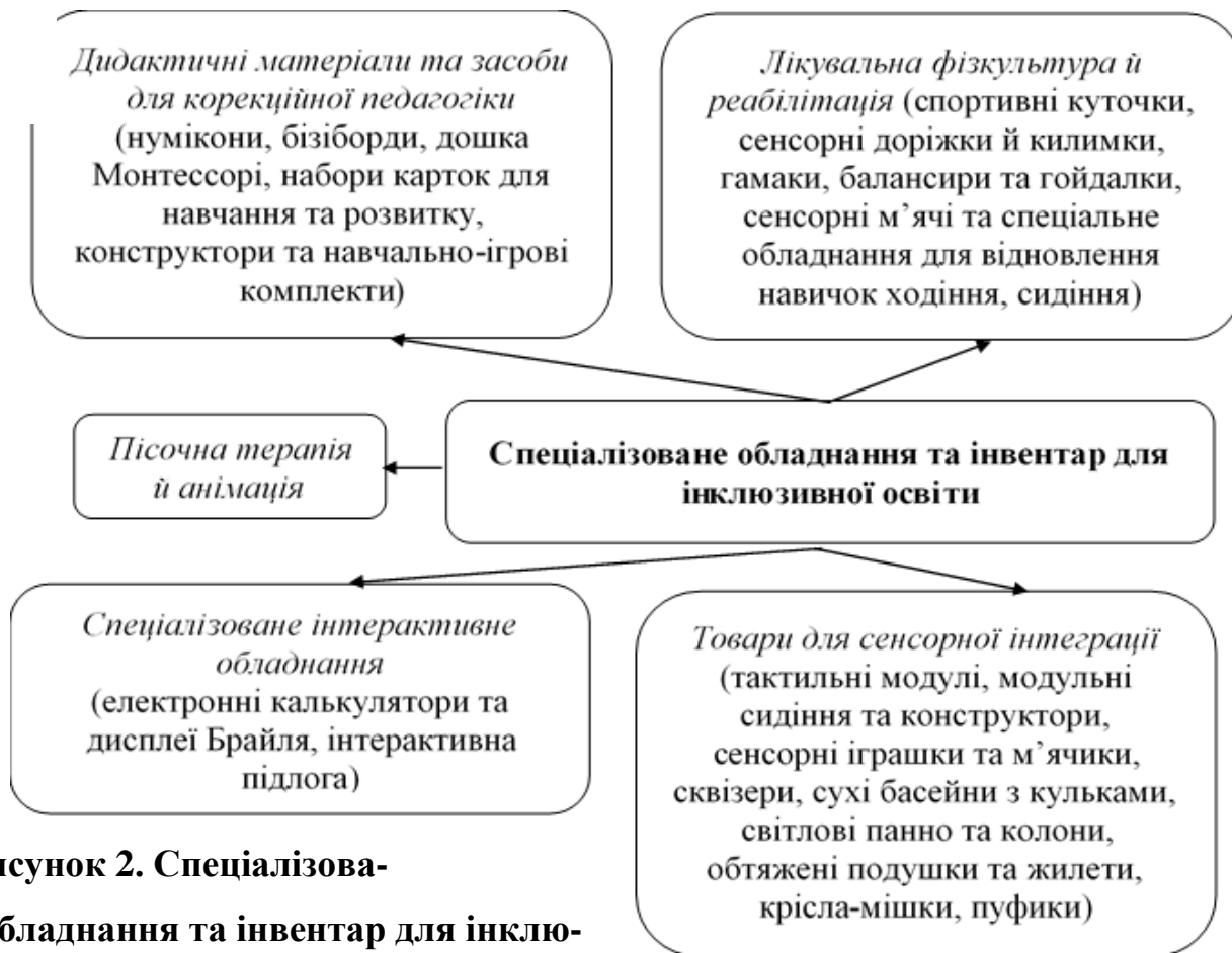
Рисунок 2. Спеціалізоване обладнання та інвентар для інклюзивної освіти